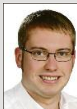
Frank Steffens Medienberatung

Tel. (04751) 901-171 Fax (04751) 901-199 riedel@nez.de