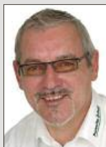
Jens Riedel Medienberatung

Tel. (04751) 901-165 Fax (04751) 901-199 kremer@nez.de