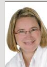
Imke Görbig Medienberatung

Tel. (04751) 901-164 Fax (04751) 901-199 wirth@nez.de