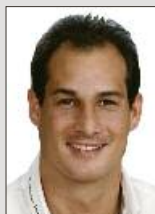
Meik Kremer Medienberatung